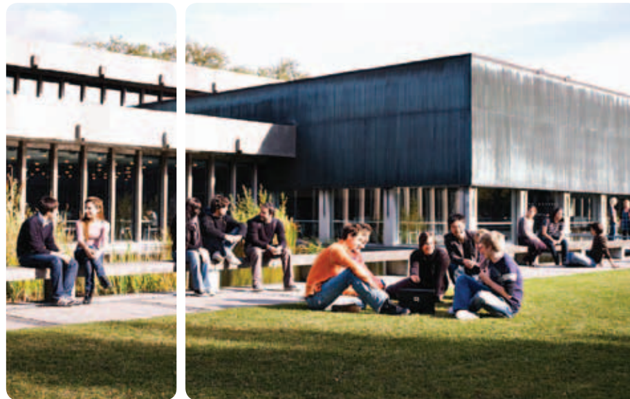
Danmarks Tekniske Universitet

Hvis et af de computersystemer, der styrer centrale dele i et fly fejler, så kan konsekvenserne blive fatale, og hvis der er fejl i den software, der styrer vaskemaskinerne i en nylanceret vaskemaskine, så er det yderst besværligt, og forbundet med betydelige økonomiske tab for producenten, at få fejlen udbedret hos hver enkelt kunde. Disse to meget forskellige eksempler illustrerer vigtigheden i at kunne udvikle computer- og softwaresystemer, der opererer korrekt fra første dag. Emner der relaterer til konstruktion af korrekte programmeringsystemer på et teoretisk, matematisk grundlag er centrale for Nordic Workshop on Programming Theory (NWPT).