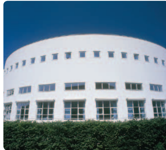
Copenhagen Business School