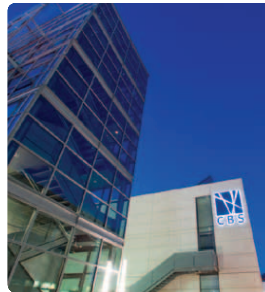
Copenhagen Business School