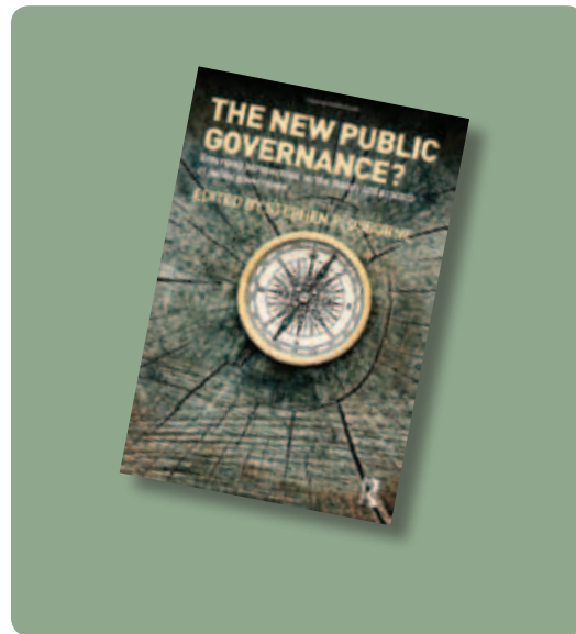
Bogen "The New Public Governance" blev publiceret 2010

En bog om "The New Public Governance", som er publiceret i 2010 har allerede stor opmærksomhed i forskerkredse, og flere af bogens kapitler blev fremlagt i udkast på IRSPM- konferencen på CBS i 2009. Bogen handler om et intensiveret samarbejde mellem offentlige og private aktører.